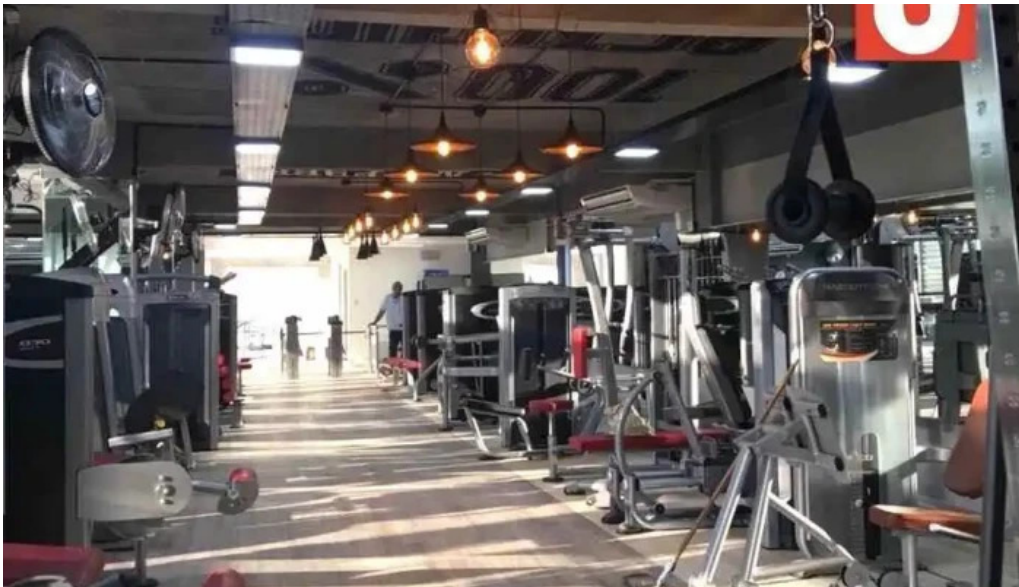
220 dos veinte electricidad del propietario