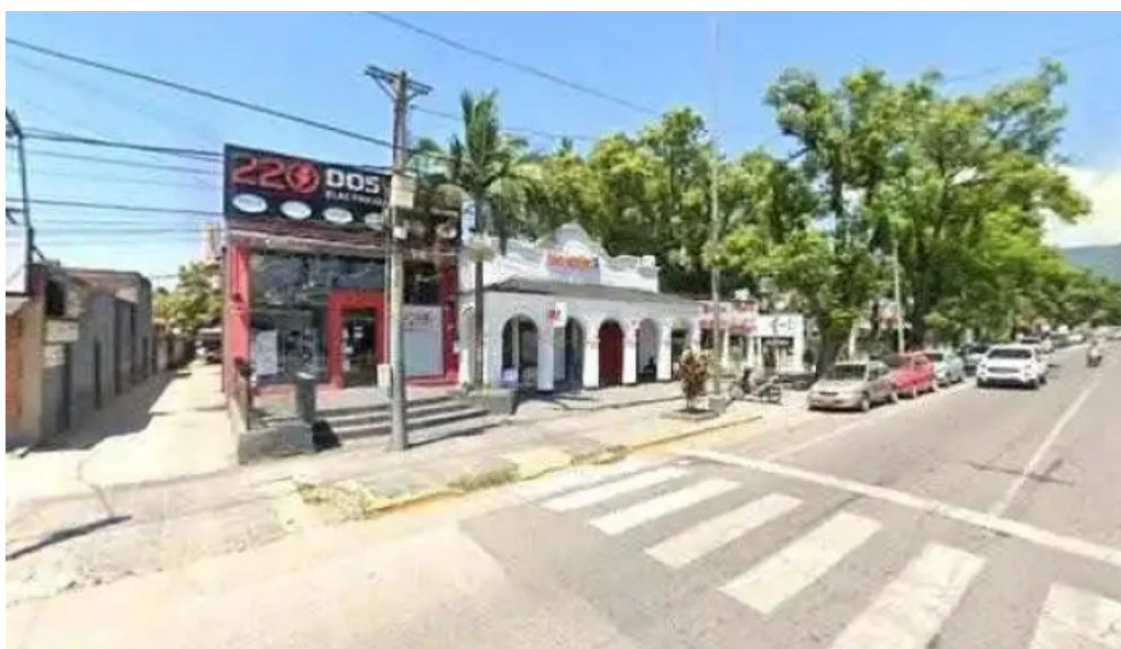
220 dos veinte electricidad ubicaciondeg