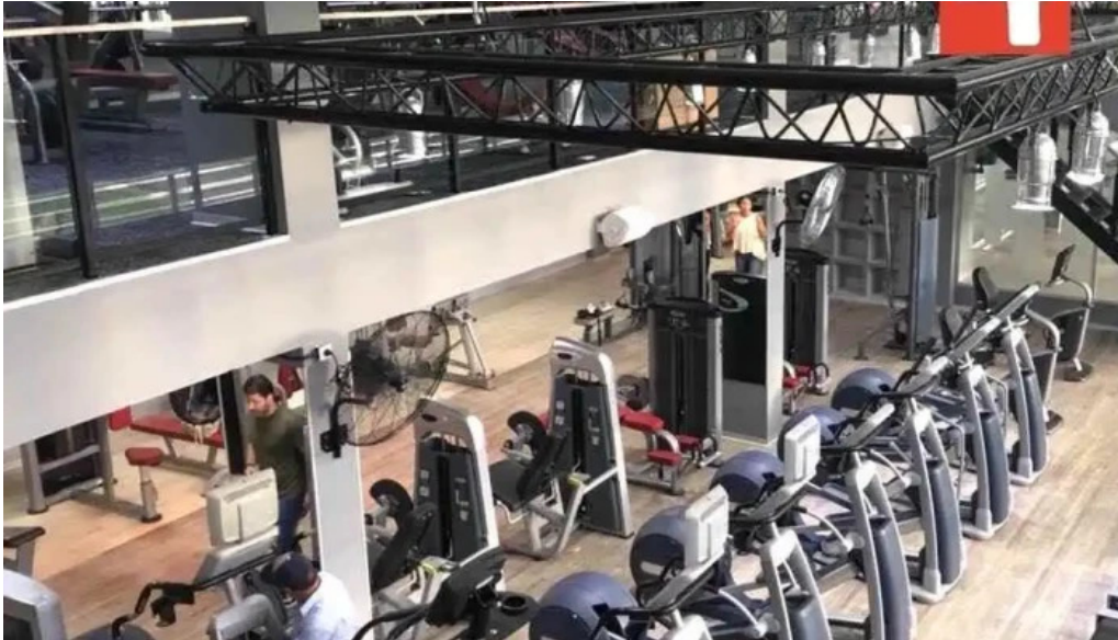
220 dos veinte electricidad interior