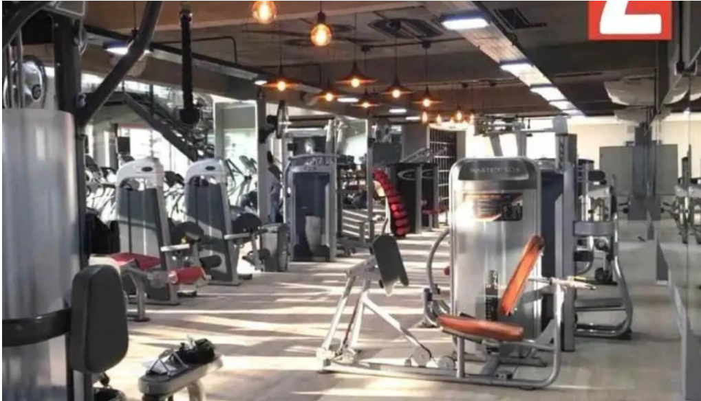
220 dos veinte electricidad ubicacion