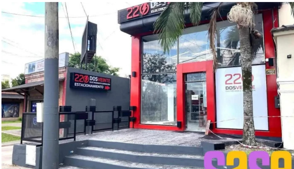
220 dos veinte electricidad yerba buena