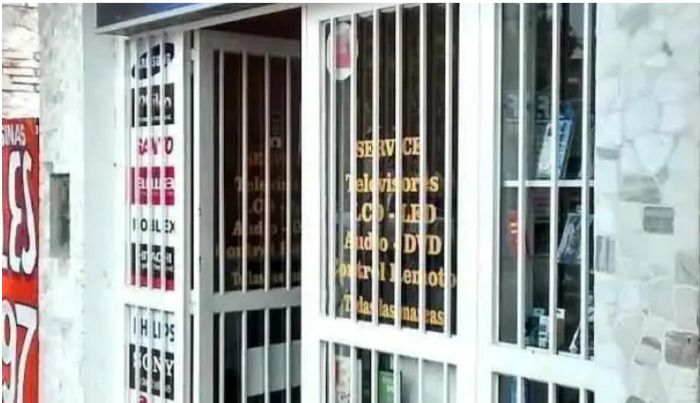
Electroxell loreto villa san martin