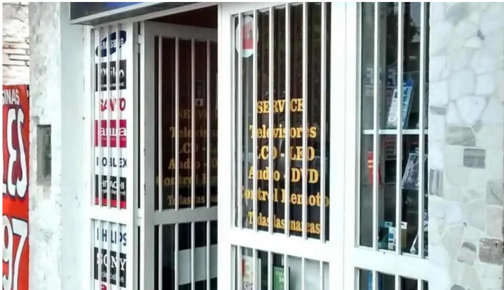
Electroxell loreto opiniones