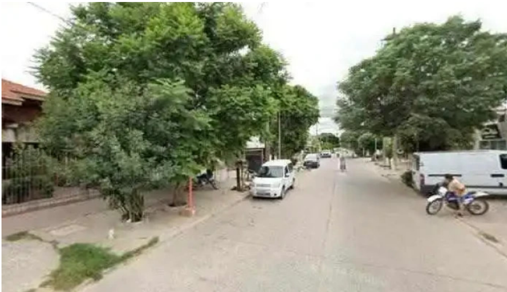
Electroxell loreto opinionesdeg