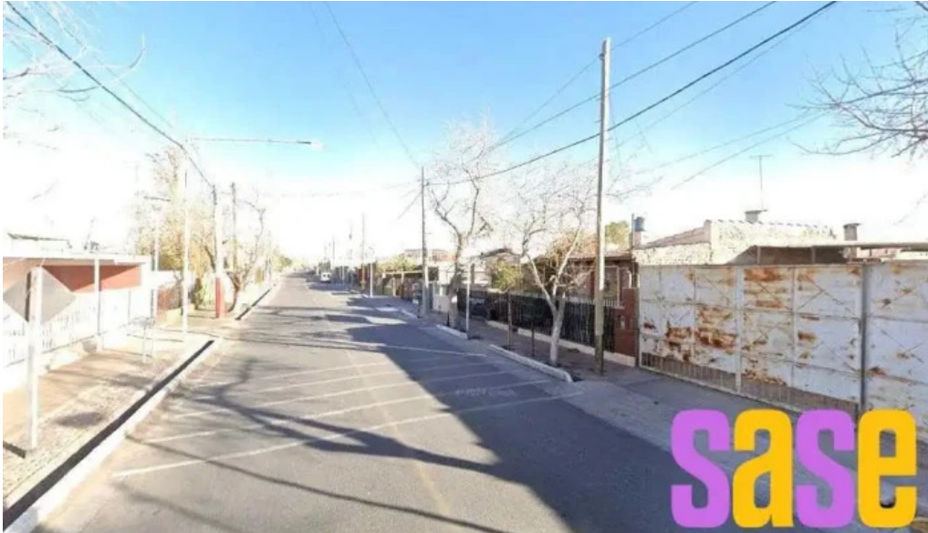
Ati electronica computacion y electricidad orlando laciar chimbas