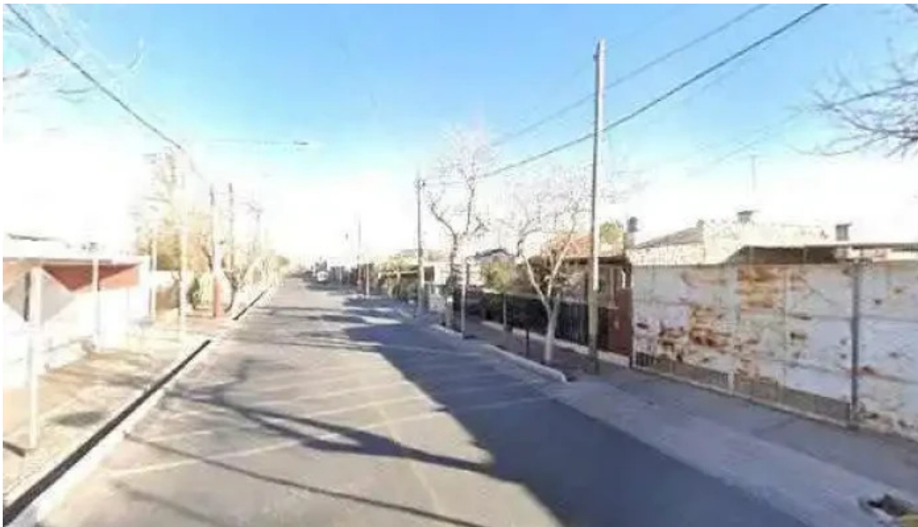
Ati electronica computacion y electricidad orlando laciar cerca de mi