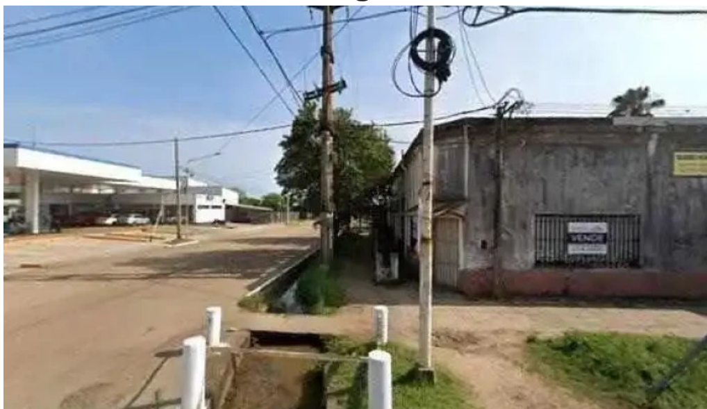
Transnea sitio web