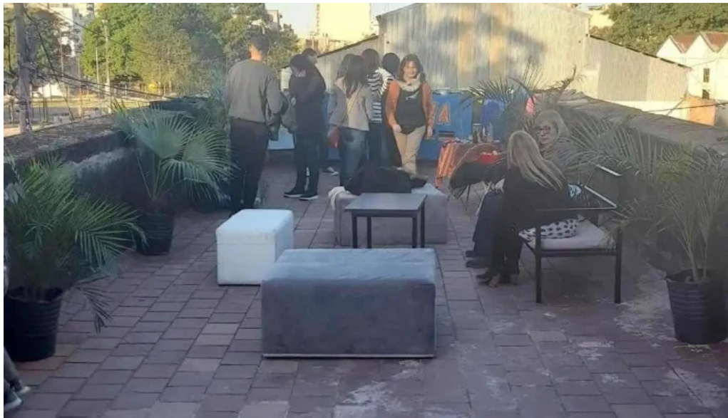
Usina electrica instagram